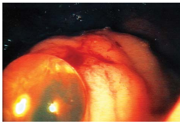
Figura 3 - Formação de bolhas translúcidas após a realização de biópsias.