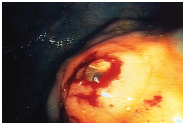
Figura 2 - Formação de bolhas translúcidas após a realização de biópsias.